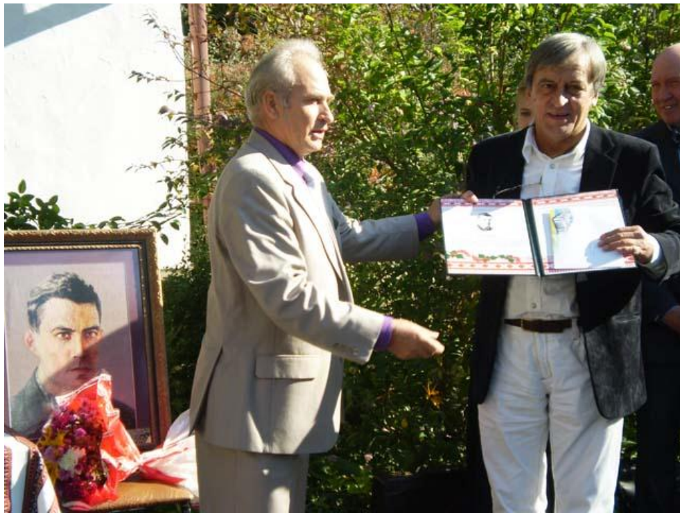
Пам'ять про Василя Стуса