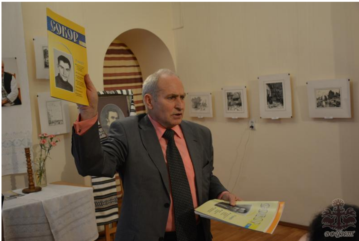
Літературно-мистецьке свято "Словом правди Україну осіни"