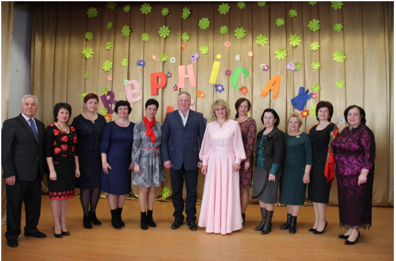
Фото на пам'ять