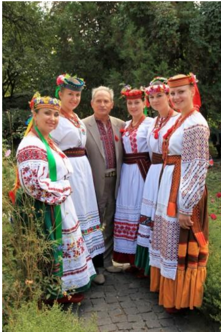
Творчі зустрічі у музеї-садибі М. Коцюбинського